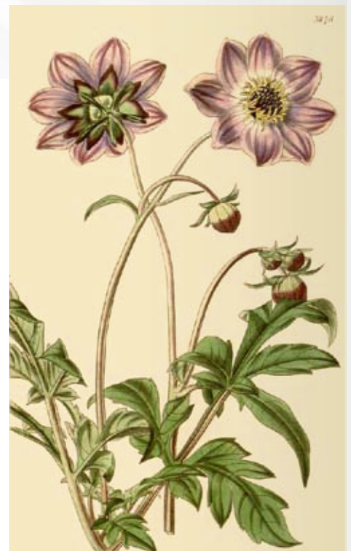
Historische Abbildung der Merck-Dahlie aus Curtis's Botanical Magazine von 1841

Genetische (Chromosomenzahl 2n=36 ) und molekularsystematische Befunde deuten darauf hin, dass Dahlia merckii in der Gattung eine recht isolierte Stellung einnimmt. Es wurde daher vorgeschlagen, die Art in eigene Gruppe, die Sektion oder Untersektion Merckii zu stellen.