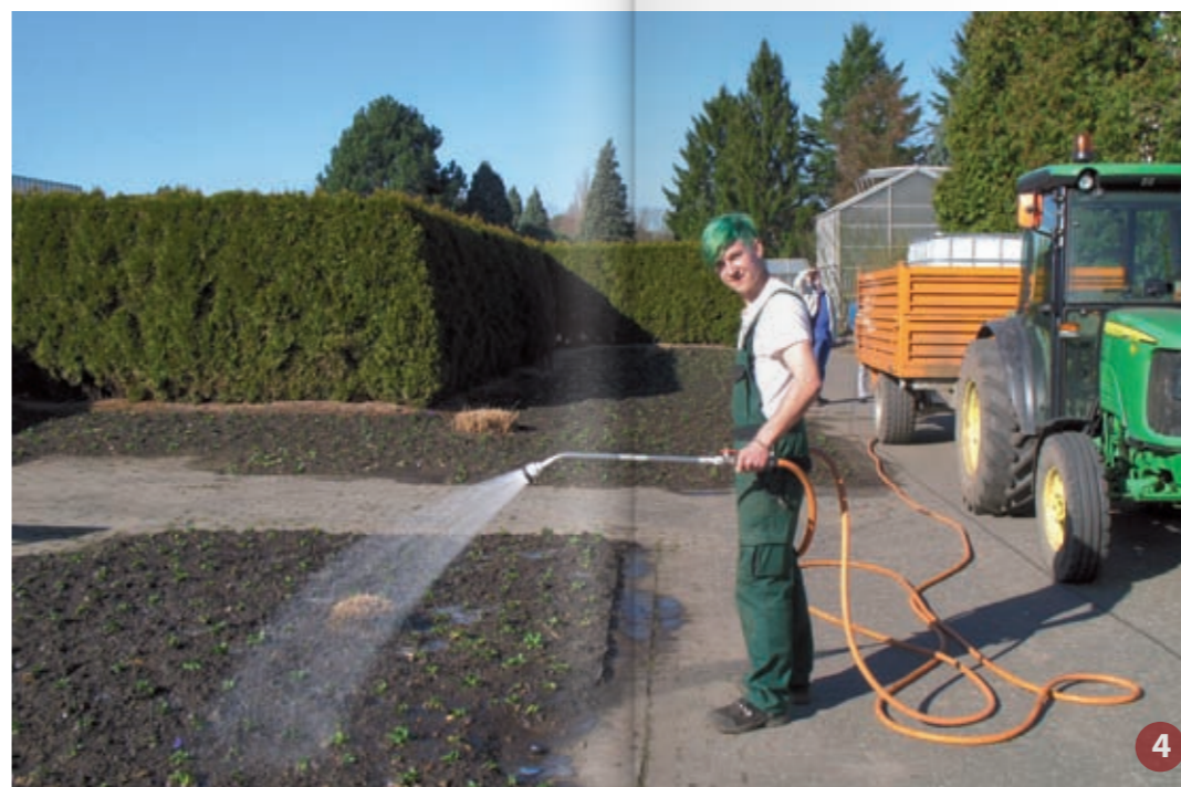
Nach der drei-, bei entsprechender Vorkenntnis zweijährigen Ausbildung erfolgt die mehrtägige Abschlussprüfung in der Landwirtschaftskammer, wo die Auszubildenden des Loki-Schmidt-Gartens häufig unter den Jahrgangsbesten zu finden sind.

Wichtiger Bestandteil der Berufsausbildung sind überdies Fachexkursionen. Hierbei können Auszubildende andere Betriebe kennenlernen, Vermarktungswege erkunden und sogar Kontakte für einen spätere