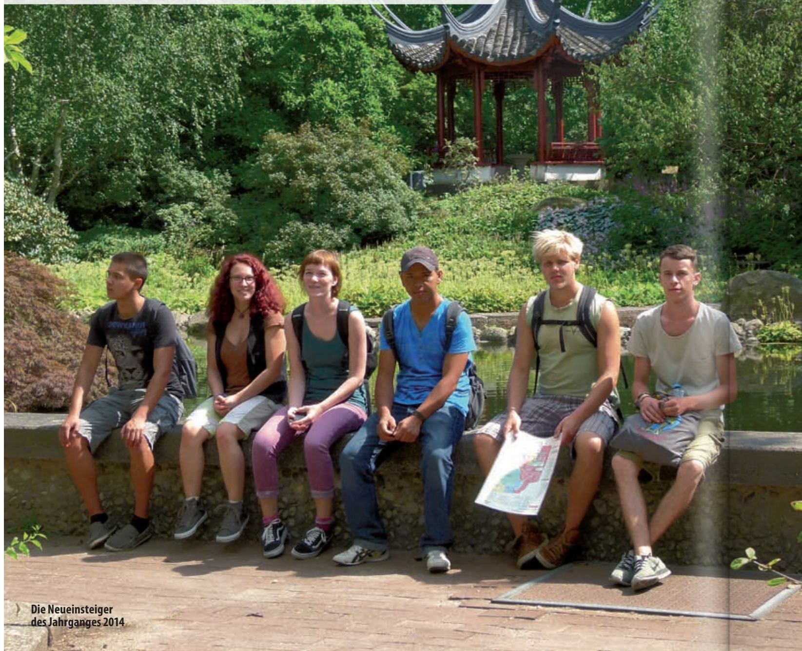
Die Neueinsteiger des Jahrganges 2014